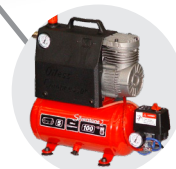
COMPRESSORE 8 bar 8 bar COMPRESSOR