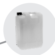
TANICA 11L TANK 11L