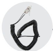
PISTOLA SANISPRAY CON TUBO SPIRALATO LUNGHEZZA 12m SANISPRAY GUN WITH SPIRAL HOSE LENGHT 12m