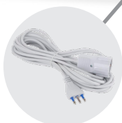
CAVO ELETTRICO DI ALIMENTAZIONE 10m ELECTRIC CABLE 10m