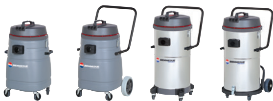
SP 70 (3/4 HP) SP 70 T (3/4 HP) SM 70 (3/4 HP) SM 70 B AC (3/4 HP)