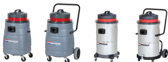
SM 50 B AC