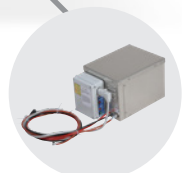
KIT VAPORE STEAM KIT