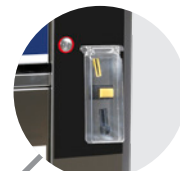
COPERTURA GETTONIERA COIN ACCEPTOR PROTECTION