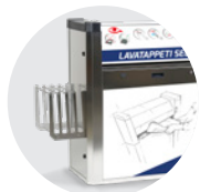
KIT MENSOLA PORTATAPPETI MAT HOLDER SHELF KIT