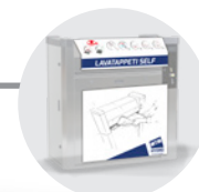
ETICHETTA (vedere pag. 175) LABEL (see on pg. 175)