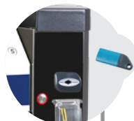
KIT EUROKEY NEXT EUROKEY NEXT KIT