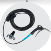
KIT ARIA COMPRESA COMPRESSED AIR KIT