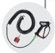
KIT NEBULIZZATORE SPRAY KIT