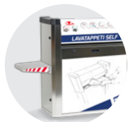
KIT MENSOLA SHELF KIT