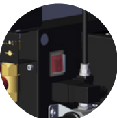
KIT ANTIGELO** NO FROST KIT**