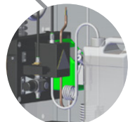
KIT ANTIBATTERICO** ANTIBACTERIAL KIT**

** KIT ANTIGELO E KIT ANTIBATTERICO DISPONIBILI SOLO IN ABBINAMENTO AL KIT ACQUA ** NO FROST KIT AND ANTIBACTERIAL KIT AVAILABLE ONLY IN COMBINATION WITH THE WATER KIT