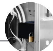
CASSETTO GETTONIERA LUCCHETTABILE LOCKABLE COIN COMPARTMENT