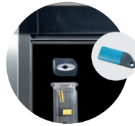
KIT EUROKEY NEXT EUROKEY NEXT KIT