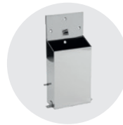
PORTA SPAZZOLA BRUSH HOLDER