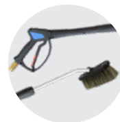
IDROPISTOLA CON LANCIA SPAZZOLA BASSA PRESSIONE LOW PRESSURE WASH GUN WITH BRUSH LANCE