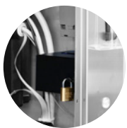
CASSETTO GETTONIERA LUCCHETTABILE LOCKABLE COIN COMPARTMENT