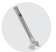
PORTA LANCIA SINGOLO SINGLE LANCE HOLDER