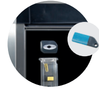
KIT EUROKEY NEXT EUROKEY NEXT KIT