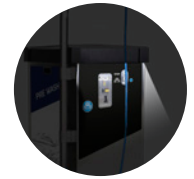
KIT ILLUMINAZIONE LED LED LIGHT KIT