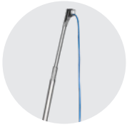
BRACCIO VERTICALE VERTICAL BOOM