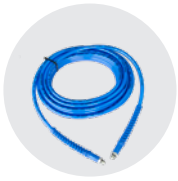
TUBO ALTA PRESSIONE HIGH PRESSURE HOSE