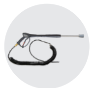
KIT LAVACERCHI/MOSKERINI (TANICA E PORTALANCIA INCLUSI) RIMS/GNATS CLEANING KIT (TANK AND LANCE HOLDER INCLUDED)