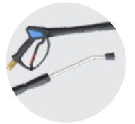
IDROPISTOLA CON LANCIA ALTA PRESSIONE HIGH PRESSURE WASH GUN WITH LANCE