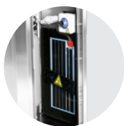
KIT ANTIGELO NO FROST KIT