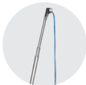
BRACCIO VERTICALE VERTICAL BOOM