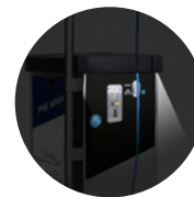
KIT ILLUMINAZIONE LED LED LIGHT KIT