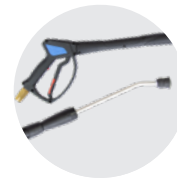
IDROPISTOLA CON LANCIA ALTA PRESSIONE WASH GUN WITH LANCE