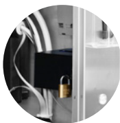
CASSETTO GETTONIERA LUCCHETTABILE LOCKABLE COIN COMPARTMENT