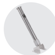
PORTA LANCIA SINGOLO (x2) SINGLE LANCE HOLDER (x2)