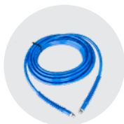
TUBO ALTA PRESSIONE HIGH PRESSURE HOSE