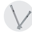
PORTA LANCIA DOPPIO DOUBLE LANCE HOLDER