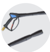
IDROPISTOLA CON LANCIA SCHIUMA ALTA PRESSIONE HIGH PRESSURE WASH GUN FOAM WITH LANCE